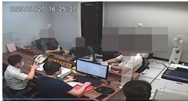
↑義務人(詢問桌右)經借提出管收所辦理分期繳納，由其配偶(詢問桌中)與妻舅(詢問桌左)到場作保。