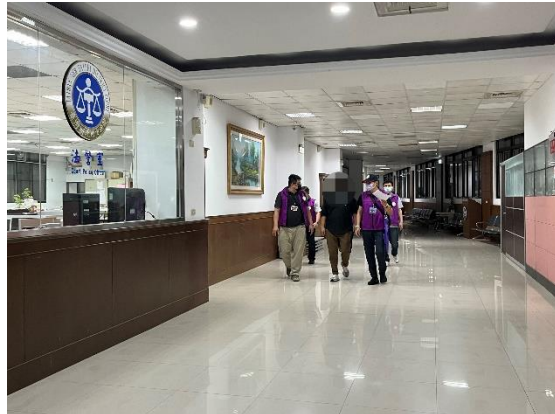
↑法院裁准管收後，書記官(右)及 2 位執行員將義務人(中)帶出法庭，準備解送管收所。