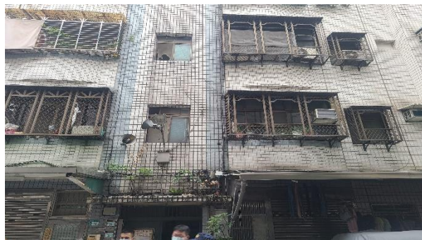
▲樹林區新興街公寓外觀