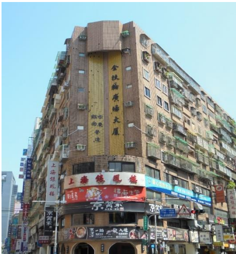
▲坐落板橋區中山路一段 (金扶輪廣場大廈)外觀