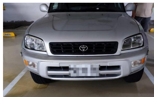
▲1997 年出廠之 TOYOTA 汽車