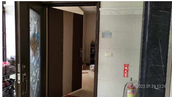
▲樹林區大安路建物一隅