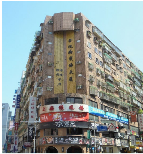
板橋金扶輪廣場大廈社區10樓 之不動產，以1,269萬元拍定