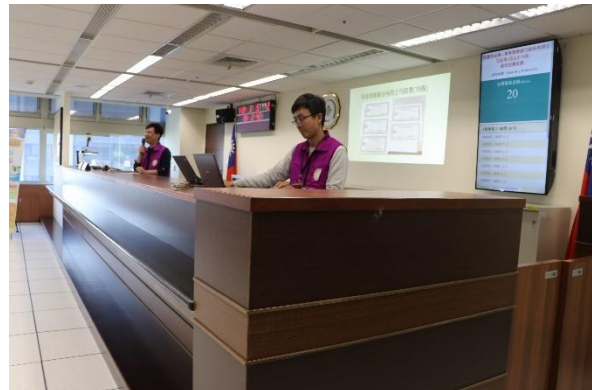
↑ 1 號李先生參與華泰商業銀行實體股票競標，以每股 20 元拍定。