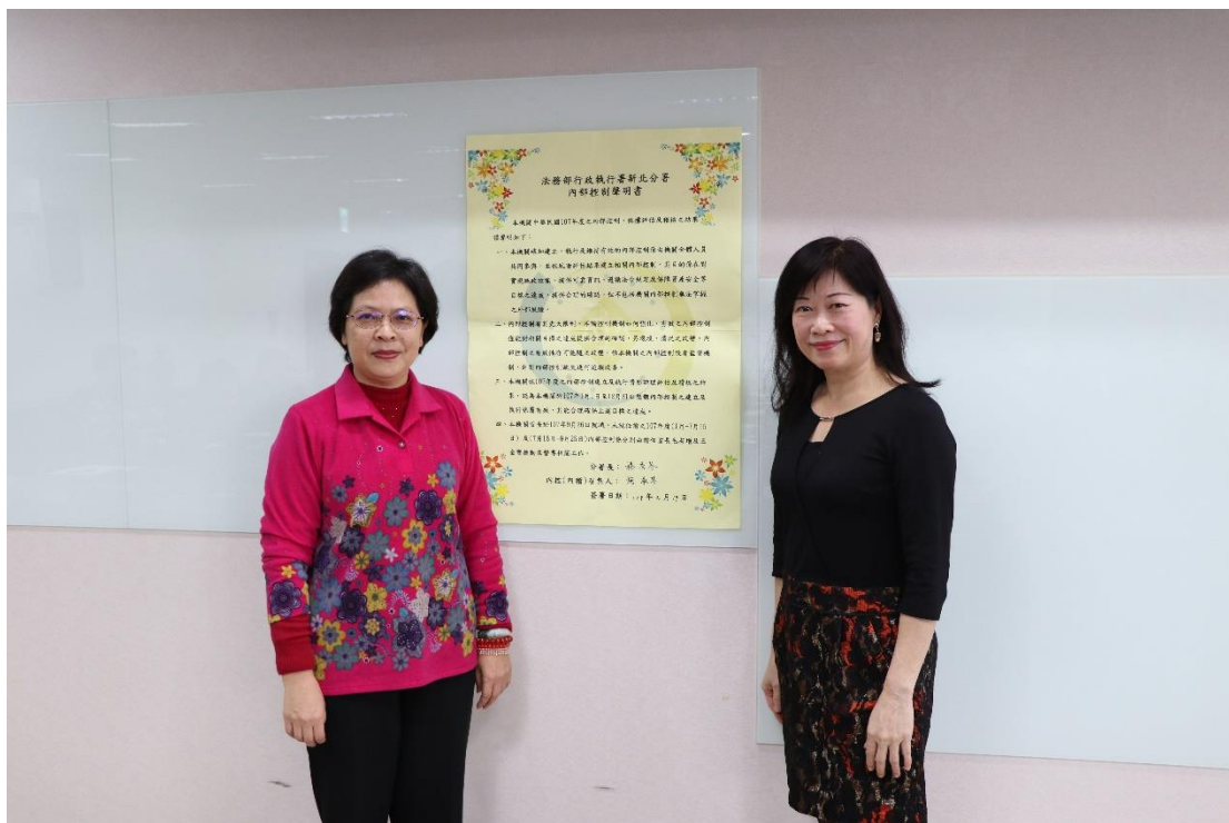
大幅「內部控制聲明書」張貼於 13 樓服務願景區提醒 全體同仁落實內部控制制度