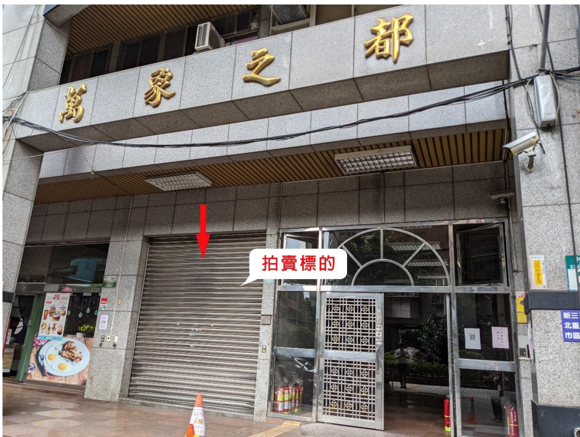
(上圖)新北市三重區中正南路 234 號(1 樓)之店面。

以上拍賣資訊如與拍賣公告所載不符，應以拍賣公告為準。欲知以上新北分署拍賣動產及不動產詳情及如何辦理通訊投標之民眾，請上新北分署官網( https://www.pcy.moj.gov.tw/ )首頁點閱「動產拍賣」、「不動產拍賣」及「不動產通訊投標」專區，瀏覽相關拍賣公告及教學資訊。進場競標、參與投標及觀看投開標之民眾請全程配戴口罩，做好個人防疫措施，並配合新北分署簡訊實聯制登記，新北分署另將全程以臉書直播，請民眾盡量以臉書觀看投開標直播，如無必要，勿至現場。