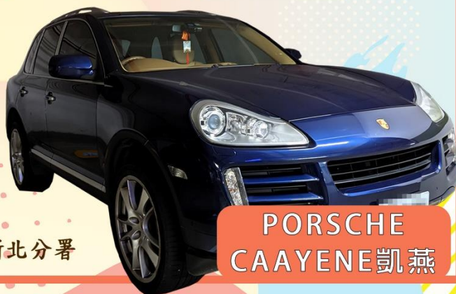
PORSCHE CAYENNE 凱燕