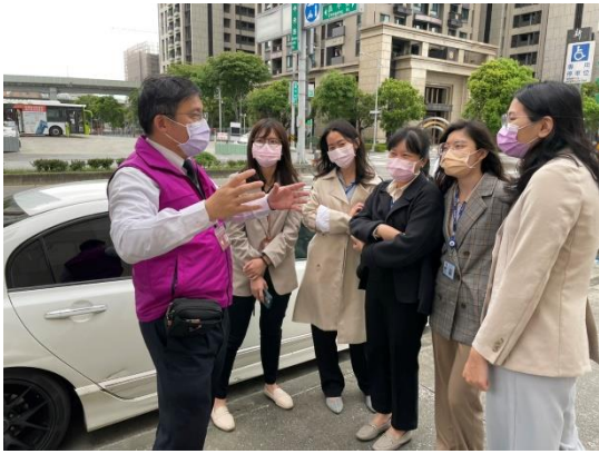
↑主任行政執行官(左) 在人行道上向學習司法 官解說查封車輛程序。