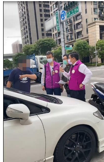
↑林姓義務人(左)突然火 氣上身，當街向執行人員 爆粗口。