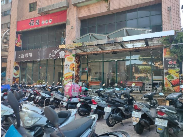
←新莊區新北大道 7 段 312 號 1 樓挑高建物外觀。