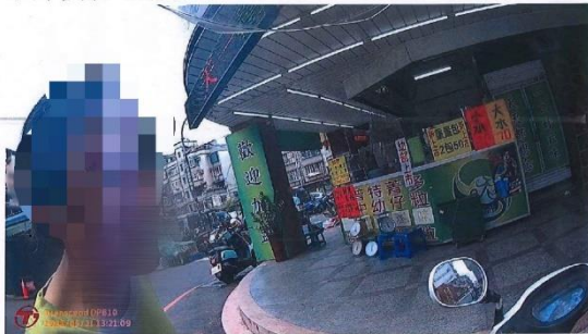
民眾陳於戶外公共空間未戴口罩

時間：110 年 05 月 21 日 13 時 20 分許 地點：新北市新莊區西盛街 承辦警員：洪