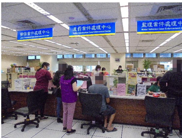
←義務人(坐者)至新北市政府交通事件裁決處設在新北分署之服務窗口繳納第 1 期分期款項。