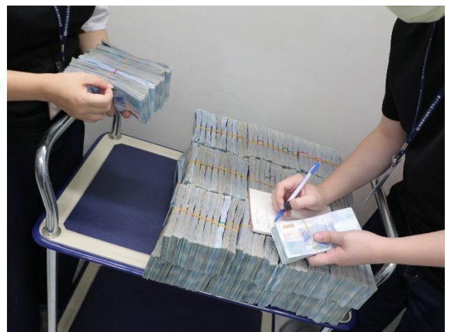
▲林女委由代理人至新北分署以現金一次繳清欠稅 1,876 萬餘元。