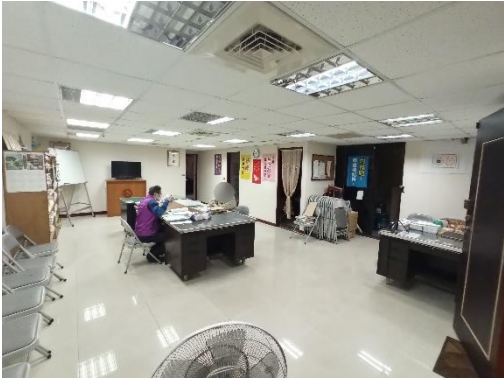
▲金扶輪廣場大廈 10 樓建物內部