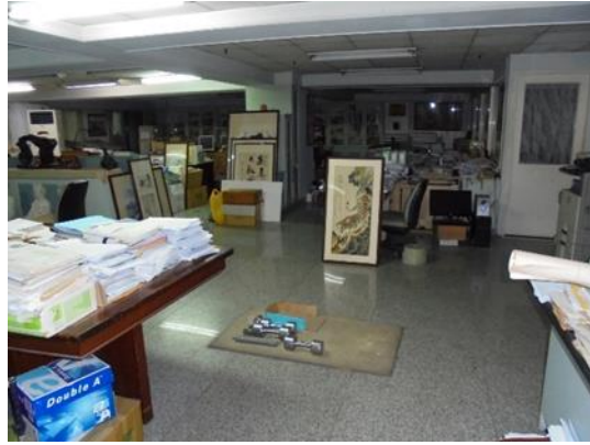
▲金扶輪廣場大廈 11 樓建物內部