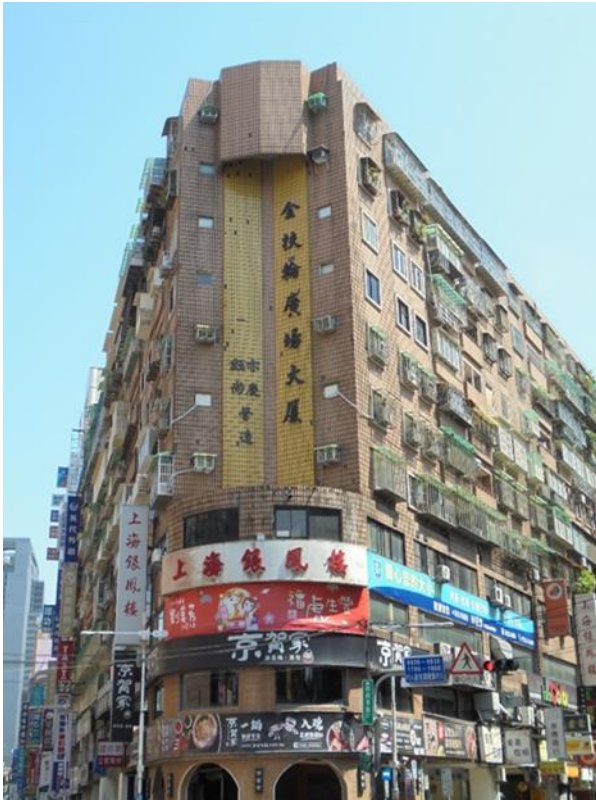
▲坐落板橋區中山路一段及館前東路大樓(金扶輪廣場大廈)外觀

投標書以雙掛號方式送達新北分署專用郵政信箱。以上拍賣資訊如與拍賣公告所載不符，應以拍賣公告為準。欲知新北分署拍賣動產及不動產詳情及如何辦理通訊投標之民眾，可上新北分署官網 ( https://www.pcy.moj.gov.tw/ ) 查詢。另新北分署於拍賣當日將全程以臉書直播，亦歡迎民眾觀看。