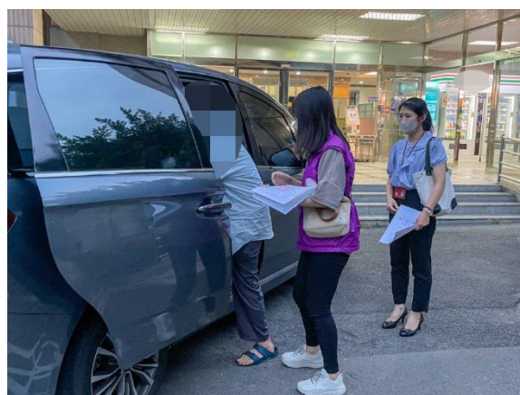
▲法院裁定准予管收後，執行人員準備解送林女（左1）前往管收所。