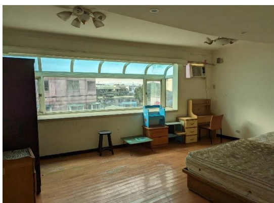
▲土城區中央路公寓內部