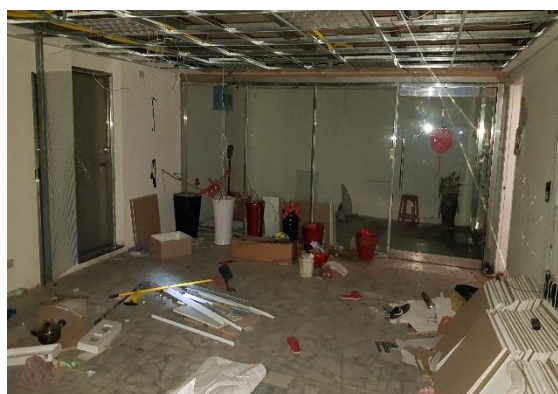
▲林口區中山路公寓公寓內部