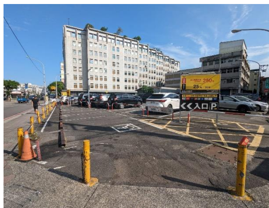
▲中和區建一路及健康路口空地