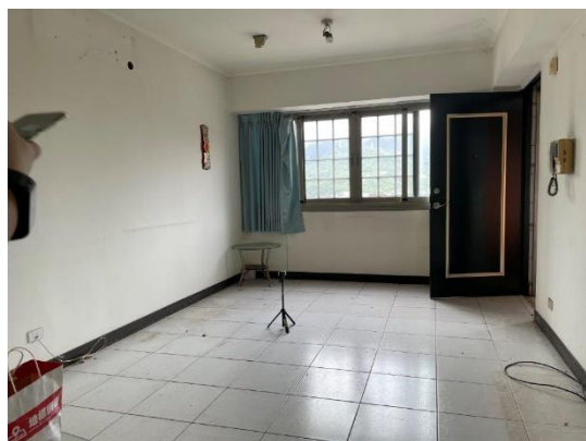
▲三峽區「薇多綠雅社區」9 樓 住家內部