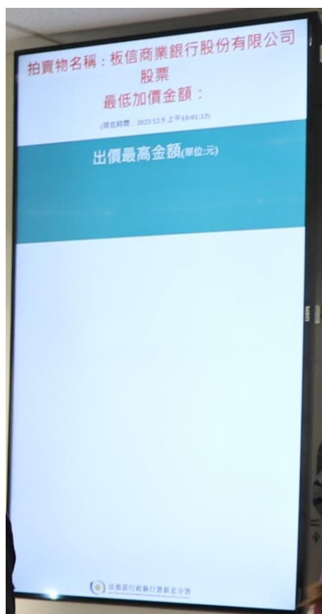
新北分署首創「動產喊價紀錄」電子看板

對於動產、不動產投資有興趣或有自用需求之民眾，請密切注意新北分署相關拍賣訊息。欲知新北分署相關拍賣訊息及如何辦理不動產通訊投標，請上新北分署官網 ( https://www.pcy.moj.gov.tw/ ) 首頁點閱「法拍專區」，瀏覽相關拍賣公告及教學資訊。