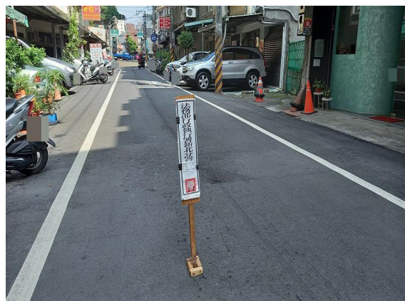
中和區南山路既成道路，以 64 萬 1,000 元拍定