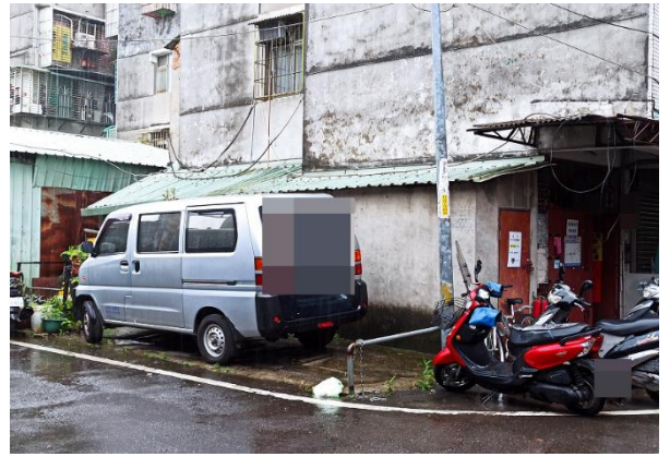
▲板橋區僑中一街巷弄內空地，以 7 萬 3,600 元拍定