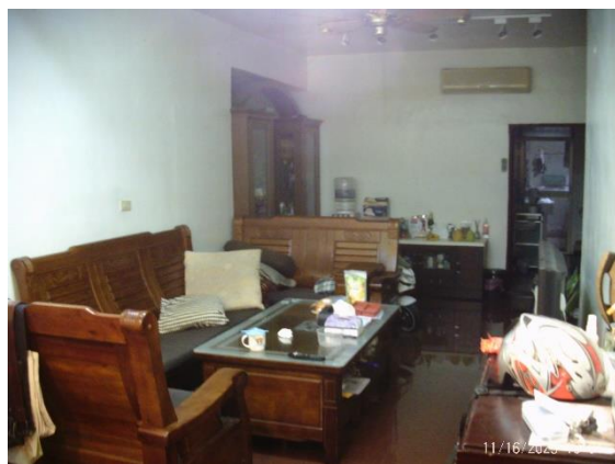
↑坐落土城區學府路一段256巷15號2樓之建物(客廳一隅)。