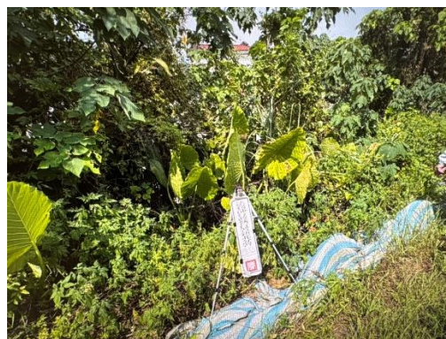
↑中和區盛昌段 397 及 398 地號土地屬於「中和都市計畫」之「保護區」。