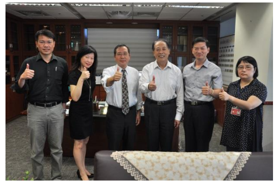
105.10.31 臺灣高等法院花蓮分院檢察署暨臺灣花蓮地方法院檢察署同仁 10 餘人，聯袂參觀本分署「執行成果與檔案巡迴展」。